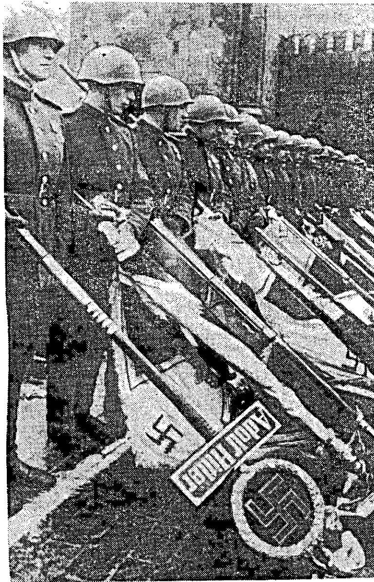
Москва. Июнь 1945 года. Парад Победы. Эти гитлеровские знамена будут брошены к подножию Мавзолея В. И. Ленина.