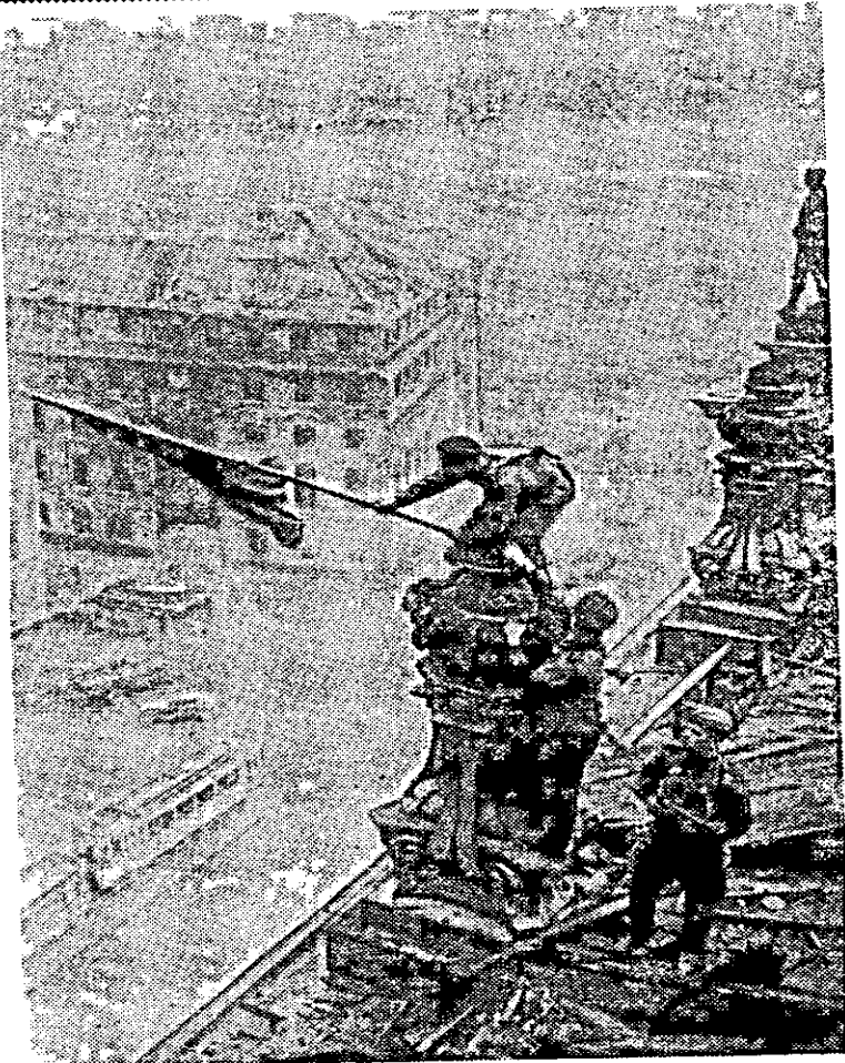
1945 год. Советский флаг над рейхстагом в Берлине.

оборону противника на Одере и Нейсе и ворвавшимися в Берлин. Москва салютовала доблестным воинам артиллерийскими залпами.