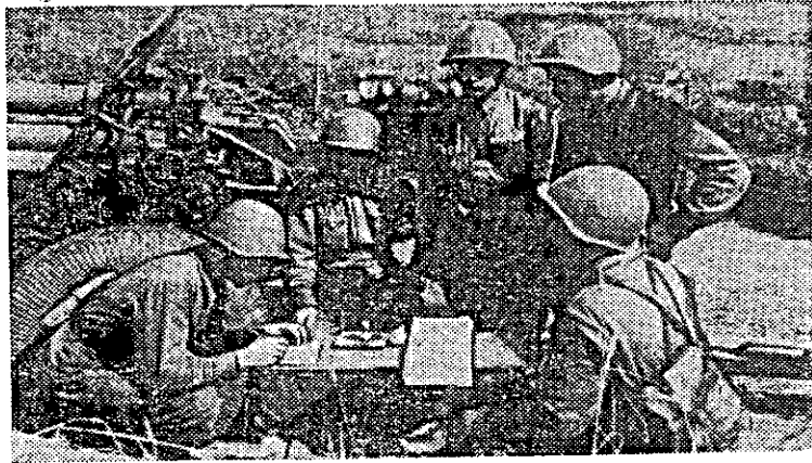
Брянский фронт, 1942 год. На снимке: вручение комсомольского билета артиллеристу из истребительного противотанкового дивизиона.