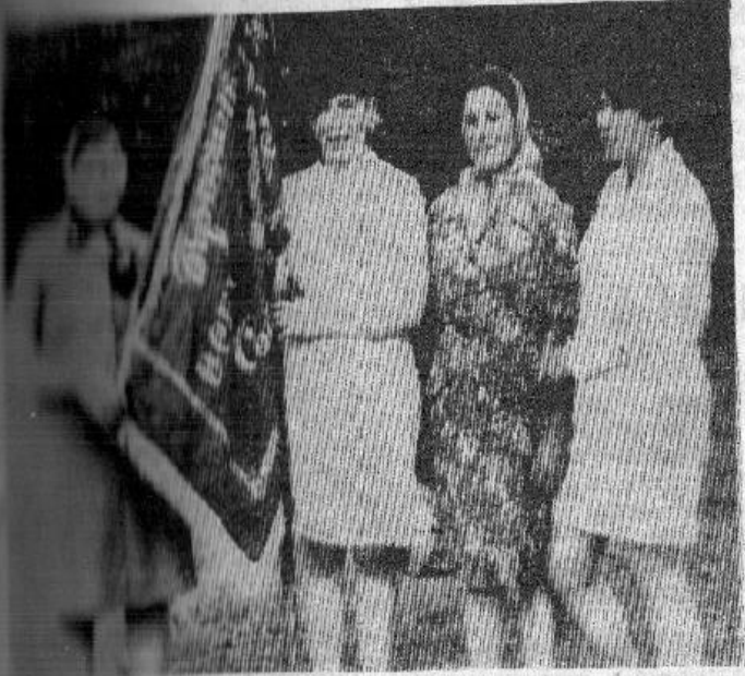
Коллектив Любимовской молочной фермы колхоза имени Карла за высокие показатели по надою молока за пять года вручено переходящее Красное знамя. В настоящее время от коровы здесь получают по 13,3 килограмма молока в сутки. На снимке: коллектив Любимовской фермы.

В Маховом полным ходом идет строительство д-