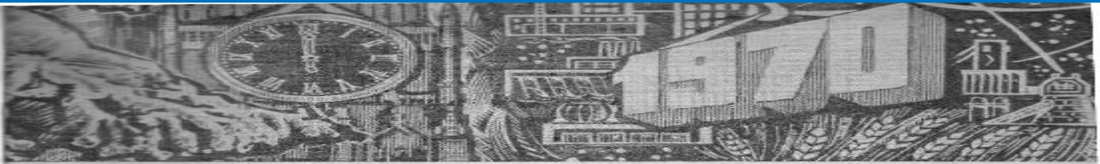
Рисунок художника Э. Лукасика (издательство «Московская правда»).