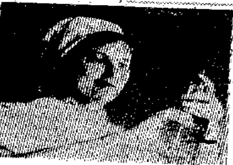
И. ИВАНТЕЕВ.

Коммунистка Нина Александровна работала в Ленинградском политехническом институте в Ленинградском политехническом институте в Ленинградском политехническом институте.